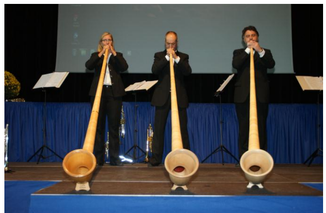
Lenzburger Schlossbläser mit Alphorn