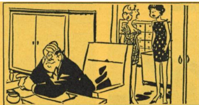
«Armer Chef! Er hat zehn Briefe diktiert und erst dann bemerkt, dass das Diktiergerät nicht eingeschaltet war.»