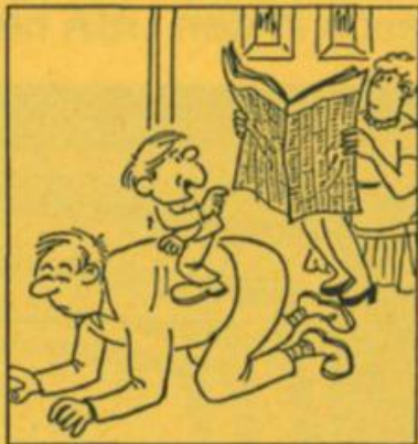
«Wir müssen Papi eine leichtere Stelle suchen. Seit er befördert wurde, lahmt er!»