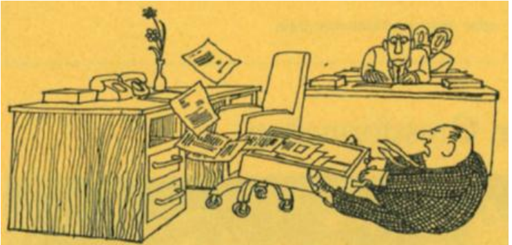
«Welcher schlaue Fuchs hat meine Schubladen geschmiert?»