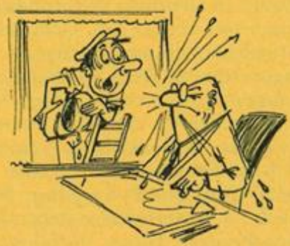
«Entschuldigen Sie bitte, Chef. Ich glaubte, das Fenster sei geschlossen.»