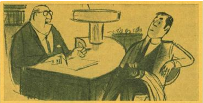
«Es gibt nur eine Alternative: Entweder Ihr Chef hat recht, oder Sie haben unrecht!»