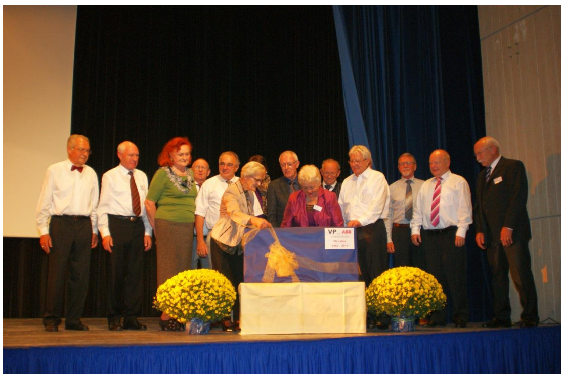
Vorstand und OK Team