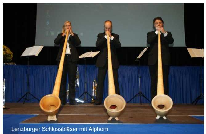
Lenzburger Schlossbläser mit Alphorn